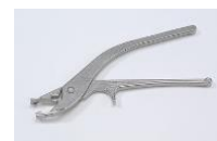
専用スライダー(別売り)