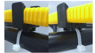
バンド止め(タテヨコ両方向対応) イレクター等の固定