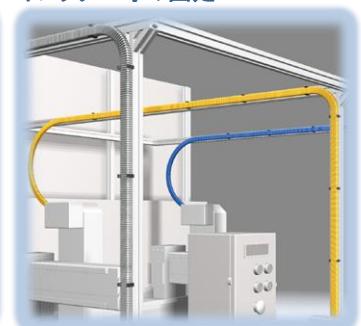
アルミフレームに！